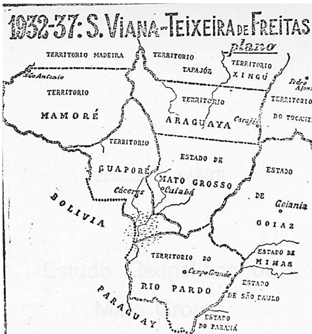
Figura 5 – Mapa do plano de redivisão do estado de Mato Grosso (1937)