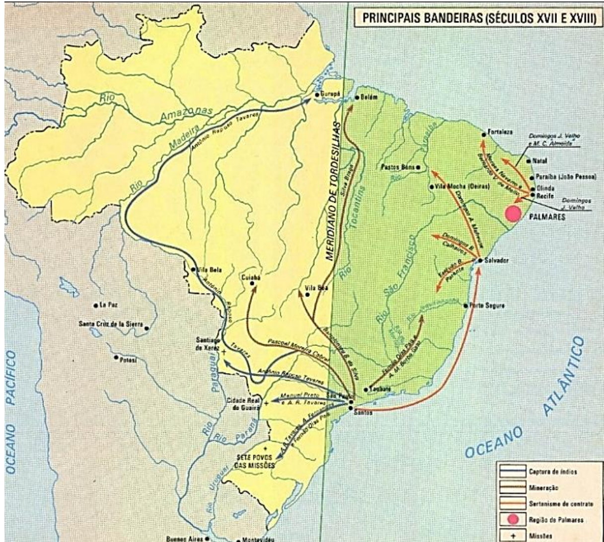
Figura 2 – Mapa do Brasil atual com o traçado de Tordesilhas e com a indicação das incursões Bandeirantes