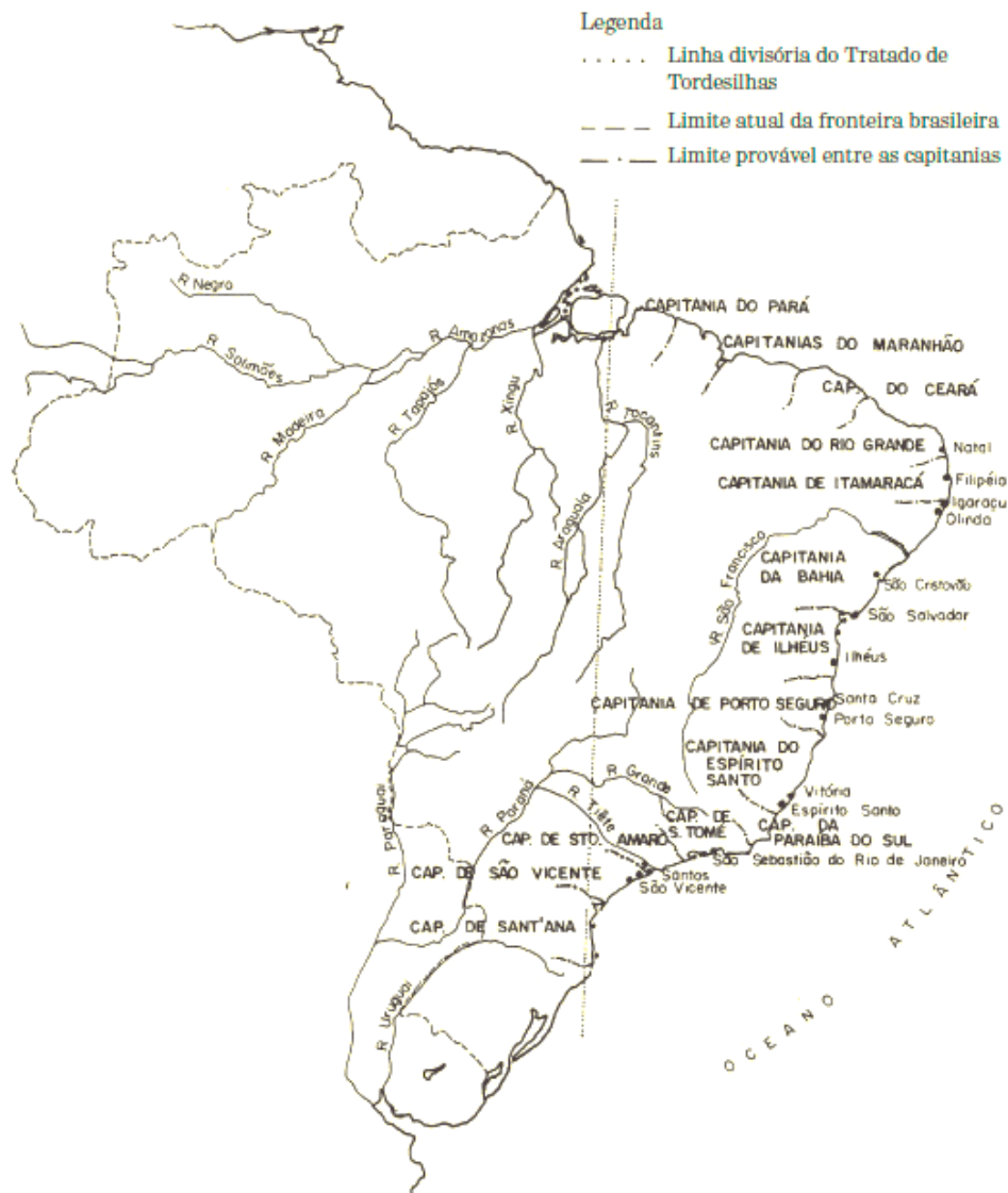
Figura 1 – Mapa do Brasil Colônia dividido em Capitanias com o traçado de Tordesilhas